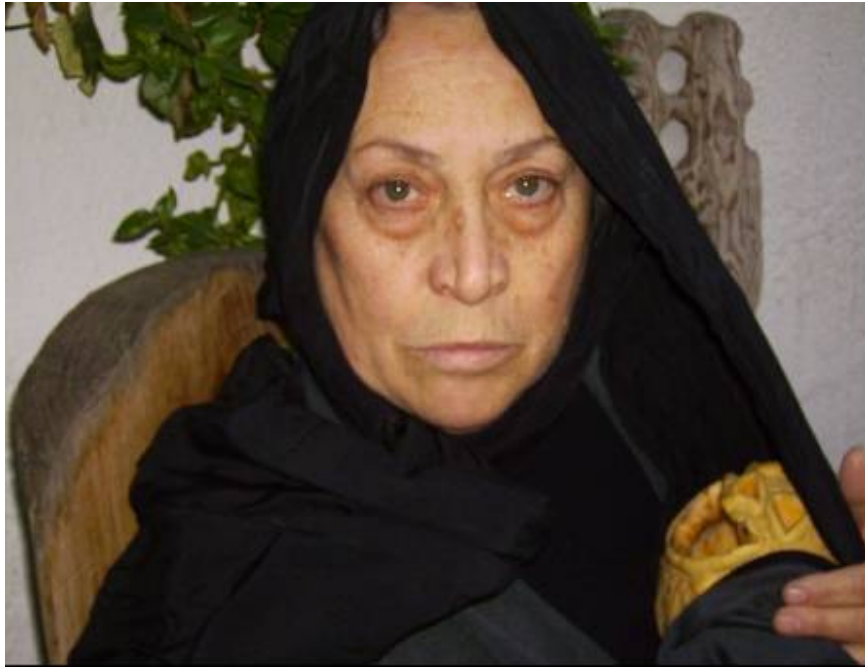
La Reina Juana despojada de los adornos de la corte

Juana está sobradamente preparada para gobernar. Aún acompañando a su madre en todas sus empresas y poseyendo la mejor educación como princesa renacentista, tanto en Flandes como en Castilla vivió cautiva como una mujer medieval hasta su muerte a los 76 años.