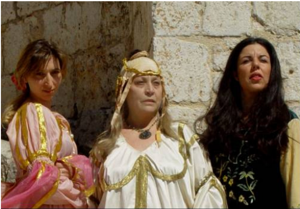
Vestuario Renacentista inspirado en Boticelli y Rafael

Encuentro de tres líderes excelentes durante la Europa del renacimiento en la prisión de Tordesillas: la Reina Juana, Beatriz Galindo y Catalina de Absburgo. La obra comienza en 1524 con el expolio del tesoro de la corona para provecho de su hijo, que sustituyó el contenido de los cofres por ladrillos. A la reina, ya con veinte años de cautiverio a sus espaldas, no le queda nada de valor para sobornar a sus carceleros y conseguir alguna mejora en el trato que la dan.