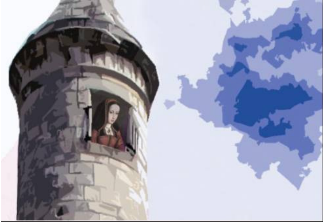
Cartel de la Tragicomedia ULTRAJE Y LEALTAD. LA REINA JUANA